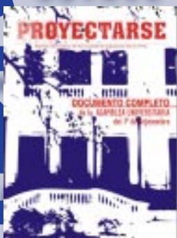
FACHADA DEL EDIFICIO CENTRAL DE LA FACULTAD DE INGENIERIA

Dirección de Relaciones con la Comunidad